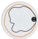
图 3 T310d 5GHz 方位 天线模式