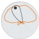
图 4 T310d 2.4GHz 俯仰 天线模式