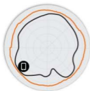
图 2 T310d 2.4GHz 方位 天线模式