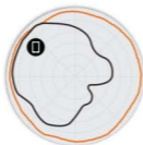
图 3 R710 5GHz 方位 天线模式