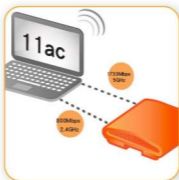
带有 MU-MIMO 功能的超快 Wave 2 4x4:4 802.11ac