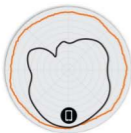
图 2 R710 2.4GHz 方位 天线模式