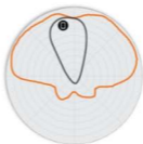
图 4 R710 2.4GHz 鲁棒 天线模式