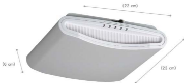
重量为 1.1 公斤。(2.3 磅)