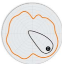
图 4. R650 2.4GHz 俯仰 天线模式