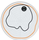
图 2. R650 2.4GHz 方位 天线模式