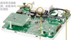
两个 10/100/1000 Mbps 端口；一个配备 PoE

高增益定向天线单元，不仅可提供信号增益，而且提供干扰抑制，从而获得扩展的信号范围、可靠性和高数据速率